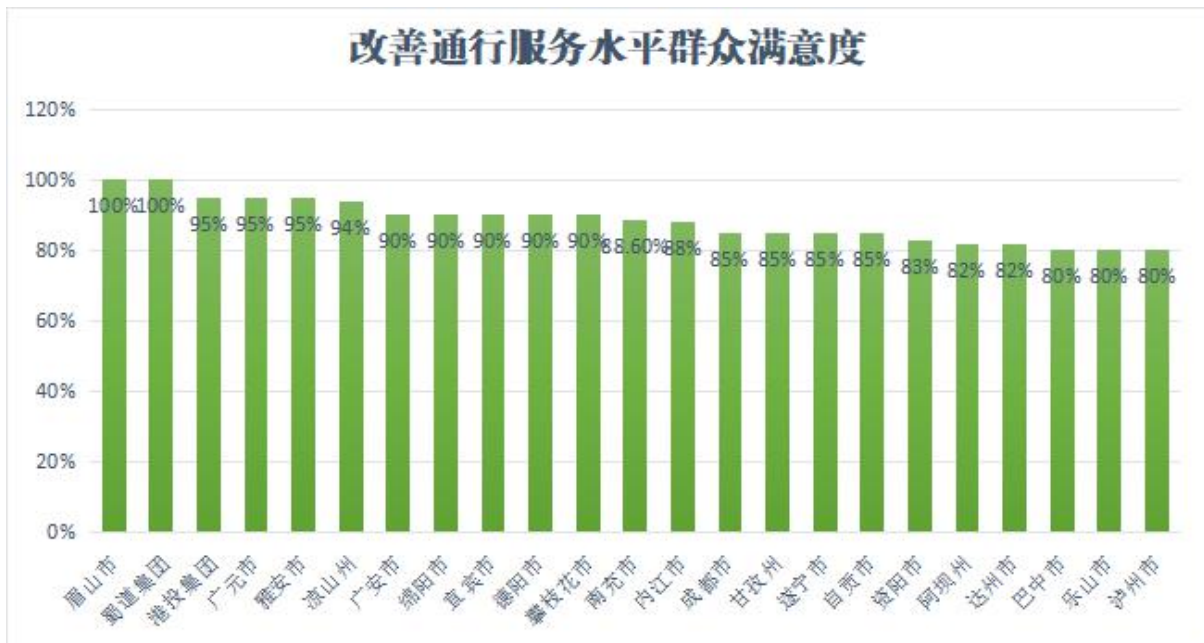
图 2 2022 年各地群众满意度统计表

自评期间，省交通运输厅组织各市（州）采取随机抽样方式，对项目所在地过往沿线居民发放满意度调查问卷、微信公众号进行满意度调查等形式，调查其对项目建成后促进当地经济发展、改善通行服务水平、保障出行安全等方面的评价情况。按照各地资金额度加权平均计算，群众满意度为 95.78%（详见图 2）。