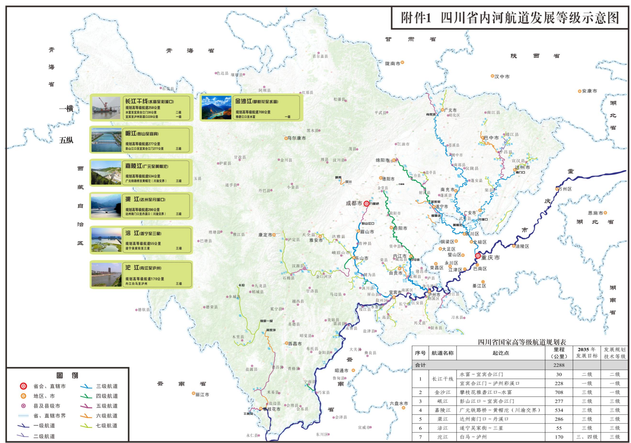
附件1 四川省内河航道发展等级示意图

长江干线(水富至彭溪口) 规划高等级航道258公里 水富至宜宾合江门30公里 二级 宜宾至泸州彭溪口228公里 一级